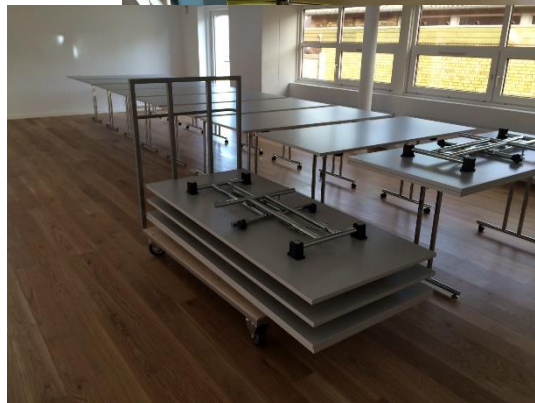
De første møbler til fælleshuset er nu modtaget. Bl.a. borde og stole til fællessal og cafeborde til torveområde.